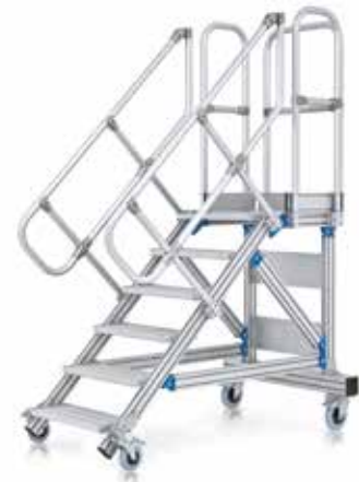
einseitig begehbare Plattformtreppe